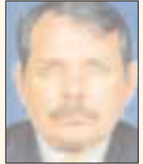
Sefer Solak Şube Mevzuat Sekreteri Şeker Fabrikası Ilica